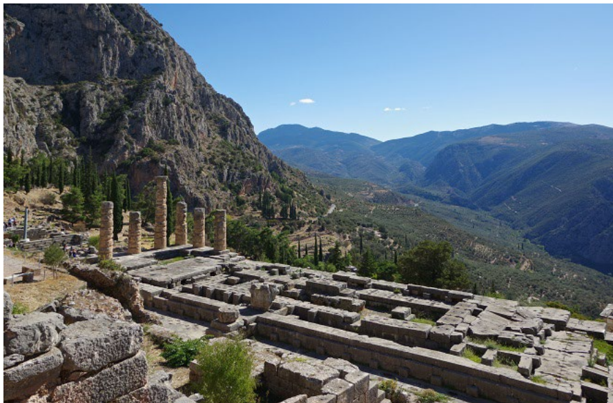
Δελφοί, Ναός του Απόλλωνα. Φωτογραφία: Berthold Werner / Wikimedia Κοινά cc κατά 3.0